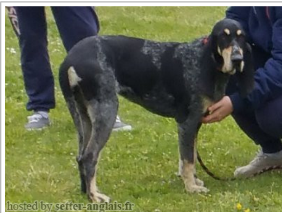
hosted by setrer-anglais.fr